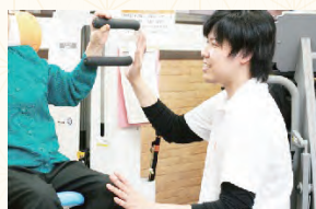
マンツーマンでサポート

軽い負荷を使った反復動作を繰り返すことで、全身の使わなくなった筋肉と神経の再活性化を図るトレーニングです。日常生活動作や歩行動作の改善に大きな効果を発揮します。