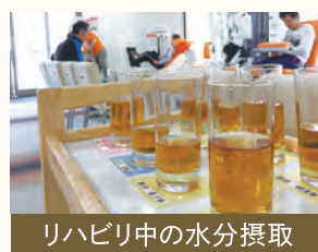
リハビリ中の水分摂取