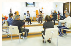
グループリハビリ