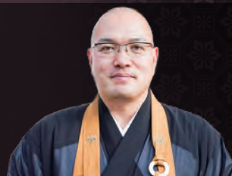
曹洞宗 塔世山 四天王寺 倉島隆行